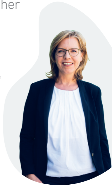
Leonore Gewessler, BA Bundesministerin für Klimaschutz, Umwelt, Energie, Mobilität, Innovation und Technologie

The past year has shown: We are picking up speed to establish sustainable mobility services. In e-mobility, in the area of sharing, and also in the Mission "Climate-Neutral City". We are continuing our work to achieve our climate targets! We must continue to invest extensively in joint projects and initiatives, monitor developments and make clear decisions. I am convinced this way we will be able to create necessary sustainable mobility services for all people.