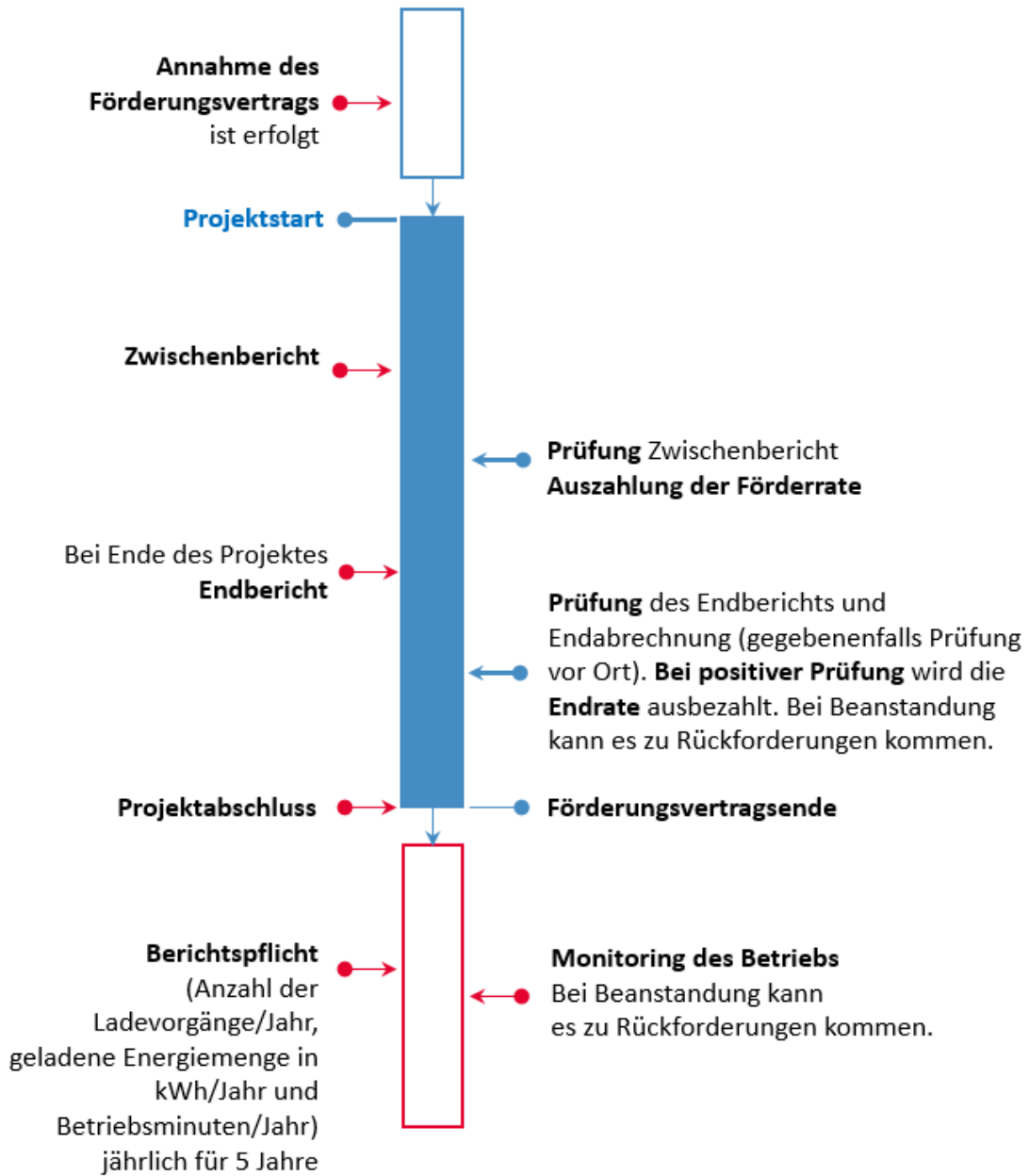
Abbildung 2: Förderungszeitraum und Monitoring